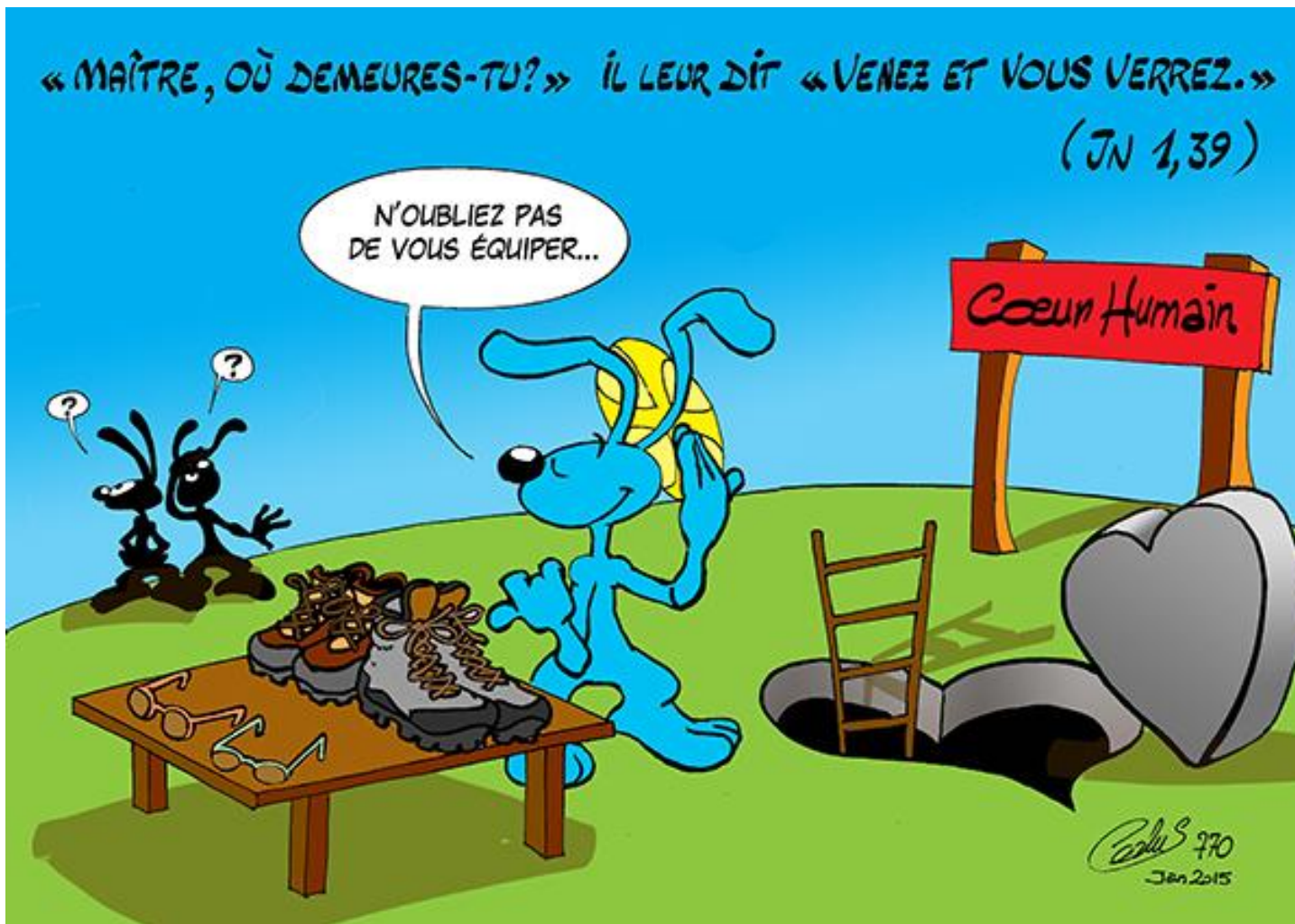
© Illustration : Coolus, le lapin bleu, disponible sur http://lapinbleu.over-blog.net/